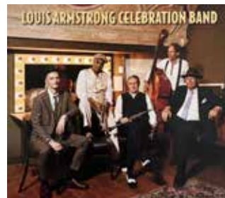
Louis Armstrong Celebration Band Eigen beheer (mede tot stand gekomen dankzij het Sena Muziekproductiefonds)