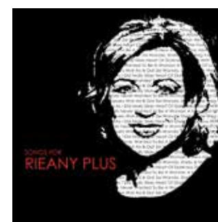
Rieany Plus Songs for R P Continental Europe CD 98

Voor akoestische muziek komt het album geproduceerd over. Wat geen slecht ding is. Dat maakt dit album toegankelijker voor een breder publiek dan alleen de jazzluisteraar. (PO) www.nyalamusic.com